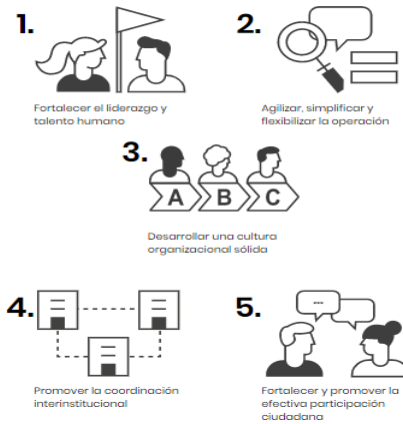
Imagen 2. Objetivos del MIGP ¿Cuáles son los objetivos de MIPG?