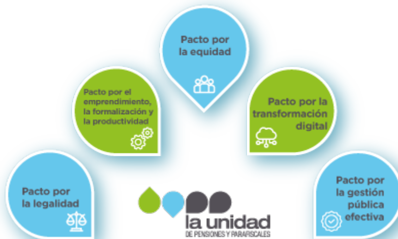
Figura 1: Pactos Plan Nacional de Desarrollo con acción sobre UGPP

En segundo lugar, el pacto por la equidad , busca promover la equidad de oportunidades e implica eliminar las barreras para la inclusión productiva de la población urbana y rural sin discriminación.