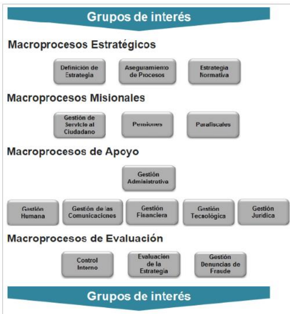
Ilustración No. 4. Procesos