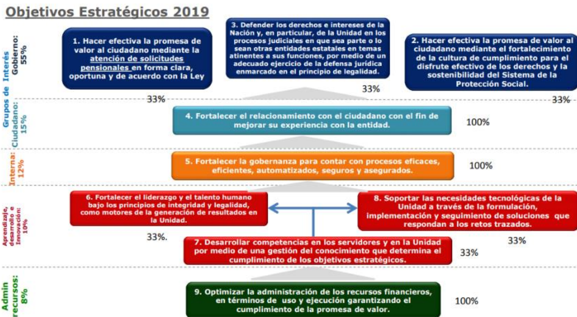
Ilustración No. 2. Objetivos Estratégico - 2019

A continuación se presenta los objetivos estratégicos para la vigencia 2019